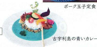
古宇利島の青いカレー