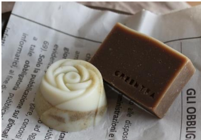
カラダに優しい石鹸